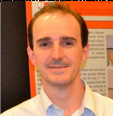
Dr. [Name] - [Title] - [Institution] - [Address] - [Phone] - [Email] - [Website]