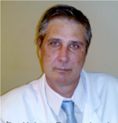
Dr. [Name] - [Title] - [Institution] - [Address] - [Phone] - [Email] - [Website]